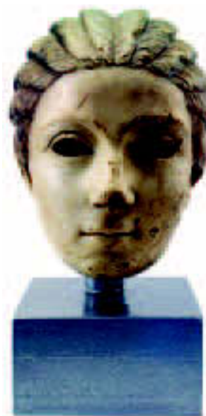
|| Tko je ona? Je li bila nitko ili netko? Arheolozi ne znaju tko je bila Solinjanka iz 3. stoljeća.

▶ Mnogo se puta sami osjećamo kao nitko i netko, a zapravo smo svi mi netko, jer iako se razlikuju, ljudi su jednaki. Društvo više prihvaća čovjeka koji je netko . Taj netko , u ovom slučaju, je onaj koji ima više novca, koji je bogat ili kod nas mladih, onaj koji nosi bolju marku odjeće. Na taj način nastaju razlike među ljudima. Ne poštujemo jedni druge po drugim osobinama, osim po izgledu. Kako bismo bili prihvaćeni u društvu, mnogo puta prihvaćamo ono što nam se ne sviđa, samo da bismo se osjećali kao netko . Društvo na taj način manipulira nama, a mi ne shvaćamo da smo i mi netko , jer je svatko poseban na svoj način i trebao bi vjerovati u sebe. Ponekad se osjećam kao nitko , kad u školi dobijem slabiju ocjenu. To je glup osjećaj. Ljudi više cijene materijalne stvari i time doprinose da se oni koji ih nemaju osjećaju kao uljezi, kao nitko u društvu koje ih okružuje. ||