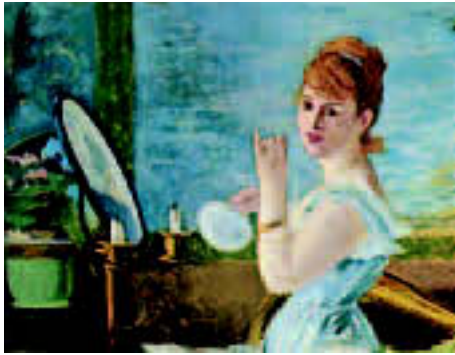
Eduard Monet || Nana (detalj)