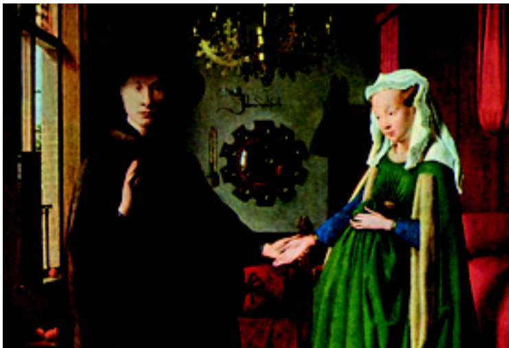
Jan van Eyck II Giovanni Arnolfini sa ženom (detalj) U malom zrcalu smještenom između supružnika vidi se odraz umjetnika.

Moja umanjena ili uvećana slika ne odgovara onome što ja uistinu jesam, mome identitetu, već onome što je u mojoj osobnosti različito od mene, nejednako meni. Iskrivljene zrcalne slike drugih, i na temelju njih moja vlastita pogrešna slika, umanjuju i uvećavaju moj lik. Ako gubim identitet kao čovjek, tada se smanjujem ili uvećavam, a u jednom i u drugom gubim svoje ja i čovječnost. Svijet je pun iskrivljenih zrcalnih slika među kojima je teško prepoznati ljudski lik.