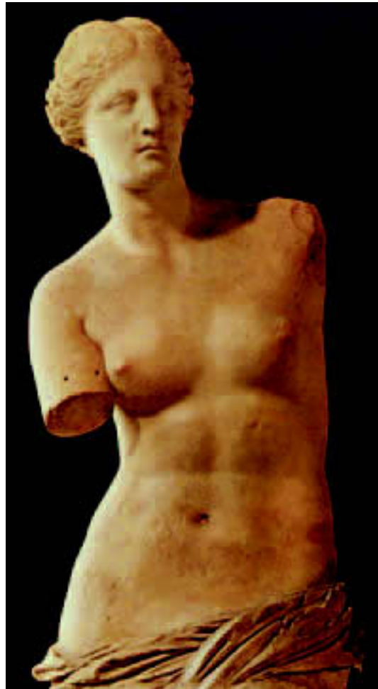
Afrodita Milska || božanska antička ljepota

Ako pridajemo preveliko značenje izgledu, a ne činimo ga ljepotom drugih obilježja identiteta prepoznatljivim, sliku koju imamo o sebi možemo umanjivati ili uvećavati, što nas u vlastitim ili u očima drugih može učiniti beznačajnima ili moćnima, ali nikako, ni u jednom slučaju, sretnima.