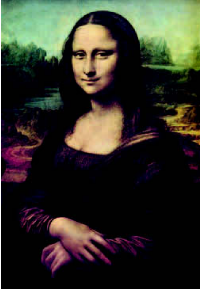
|| Mona Lisu Leonarda da Vincija ubrajamo među najpoznatije žene svijeta. Ipak, ne možemo sa sigurnošću reći tko je ona uistinu bila. Netko ili nitko?

vrijednosna slika u kojoj su stvari važnije od ljudi, i u kojoj se vrijednosti mjere po onome što tko posjeduje, a ne po onome što tko jest. Isto tako postoje ljudi koji misle da su jedino oni sposobni da budu netko, a svi ostali trebali bi se podrediti njihovom načinu mišljenja i djelovanja.